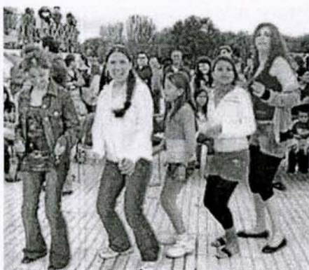
Los más jóvenes del distrito se lanzaron a bailar los ritmos bolivianos.

Los vecinos de Usera no quieren que el parque Pradolongo vuelva a salir atado a la crónica policial. Por eso, tres redes sociales del distrito -unas 25 organizaciones- se lanzaron a recuperar el parque, para que el siguiente titular que aparezca en la prensa diga que Pradolongo es un espacio de encuentro multicultural. Bajo el slogan de "conviniendo juntos, remezklate" se convocó a los vecinos el 31 de mayo. Decenas de personas acudieron a la cita, y hubo representantes de distintos países: Bolivia, Chile, Bulgaria y Camerún. Bolivia puso a bailar a todos. La agrupación Ayni -que en quechua significa "ayudarse"- representó el tinku, que es una danza ritual que hace referencia al encuentro de dos pueblos diferentes.