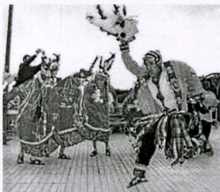
El Tinku fue interpretado por el grupo Ayni, que hace 2 años trabaja en Madrid.